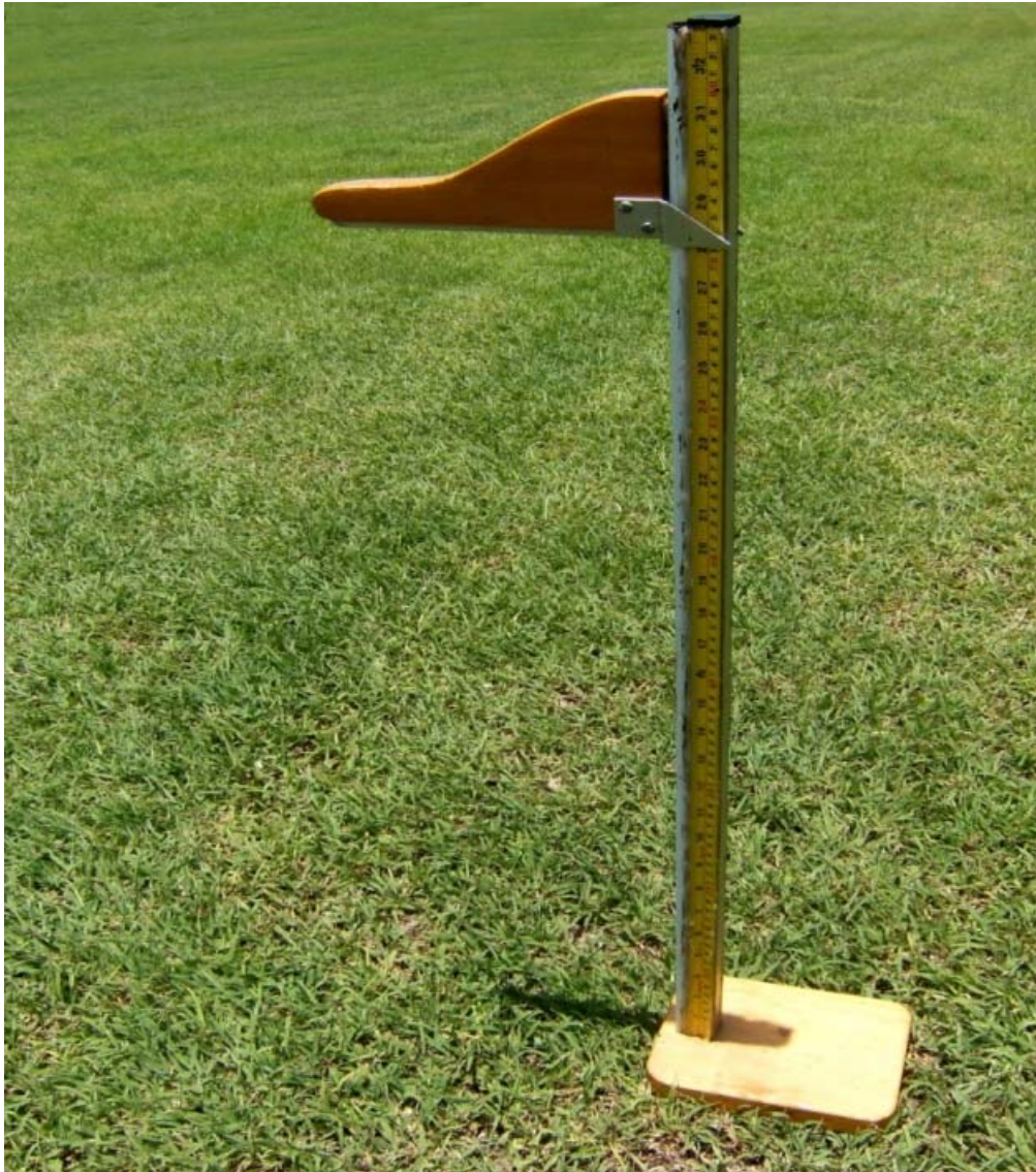
Figura 3. Instrumento de medición de alto de rodilla.