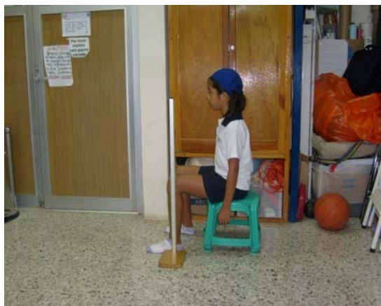
Figura 4. Técnica de medición de alto de rodilla.